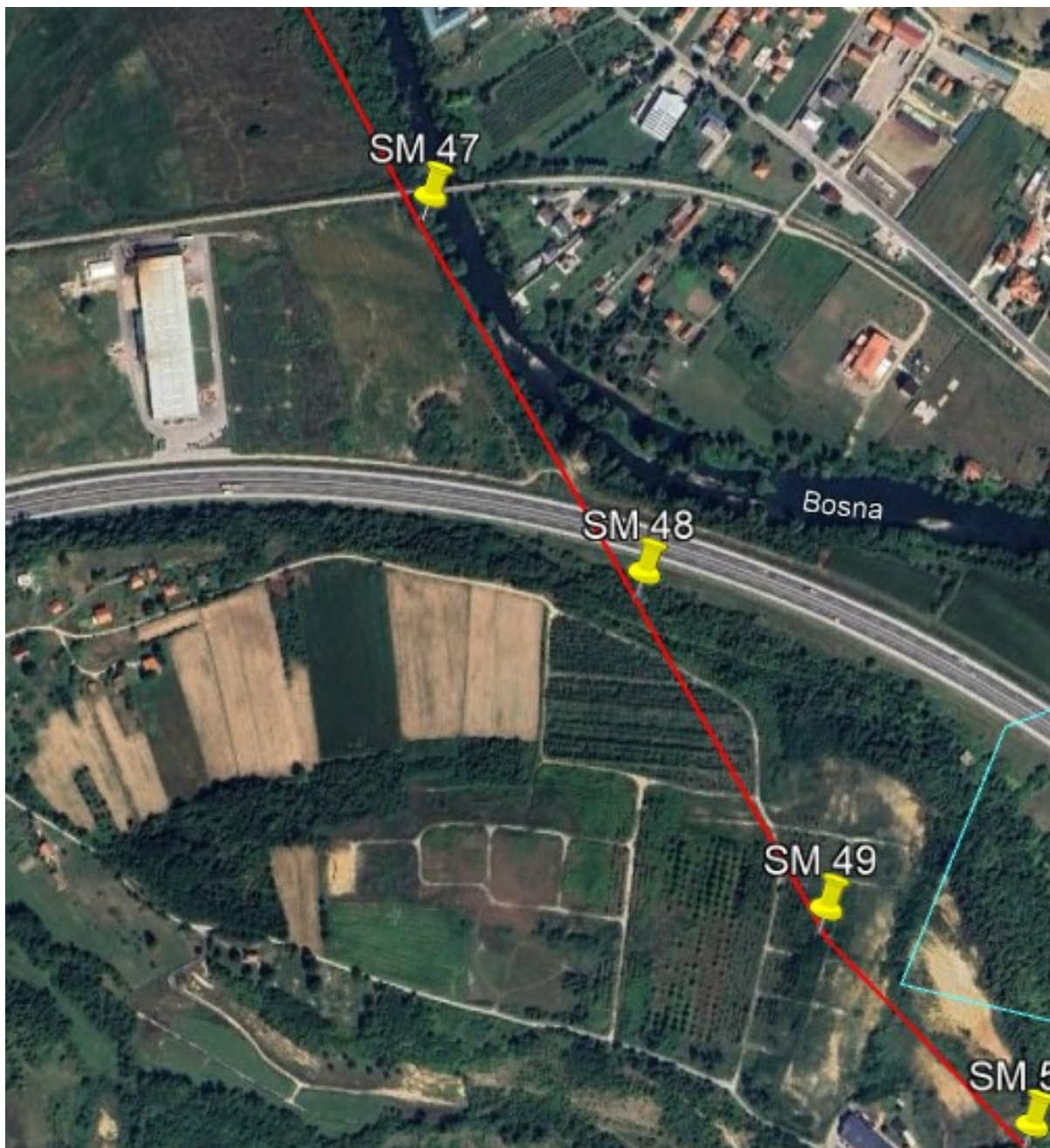
Sl. 5. Situacija trase