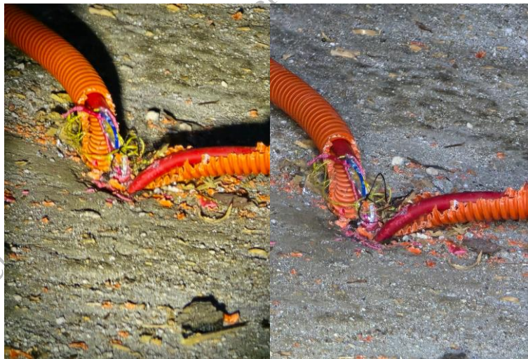
Primjer uništenih instalacija

Na sljedećoj slici dan je primjer štete na instalacijama.