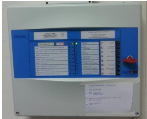
Postojeća vatrodajavna centrala

U objektu TS Grude vatrodajavni sustav instaliran je prije više od 15 godina. Vatrodajavna centrala je ispravna ali su pojedini javljači van funkcije. Vatrodajavna centrala je konvencionalna vatrodajavna centrala proizvođača Morley IAS "Horizon" serija sa 8 zona. : Horizon – Morley IAS vatrodajavna centrala. Kabelske trase koje se nalaze u potkrovolju objekta su „pokidane“ od strane glodavaca i iste je potrebno zamijeniti i ispitati.