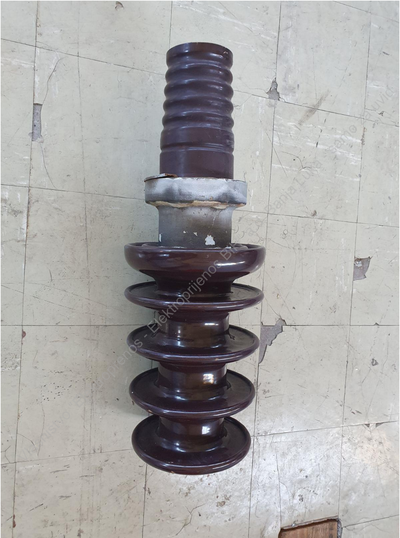
Dodatak: Slika 1-5