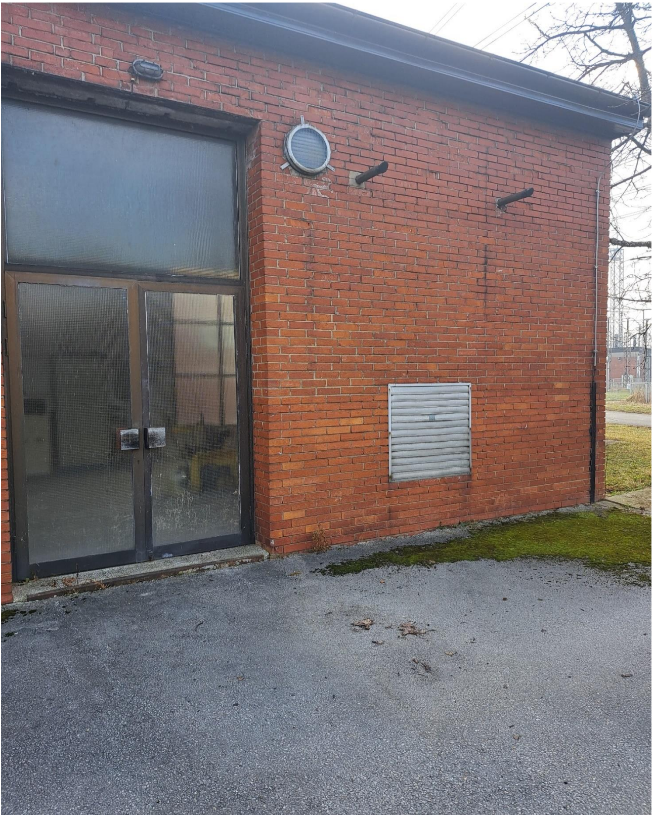
Slika br. 4 Vrata prostorije za smještaj dizel agregata, izduvni sistem i žaluzine za topli vazduh sistem za hlađenje motora