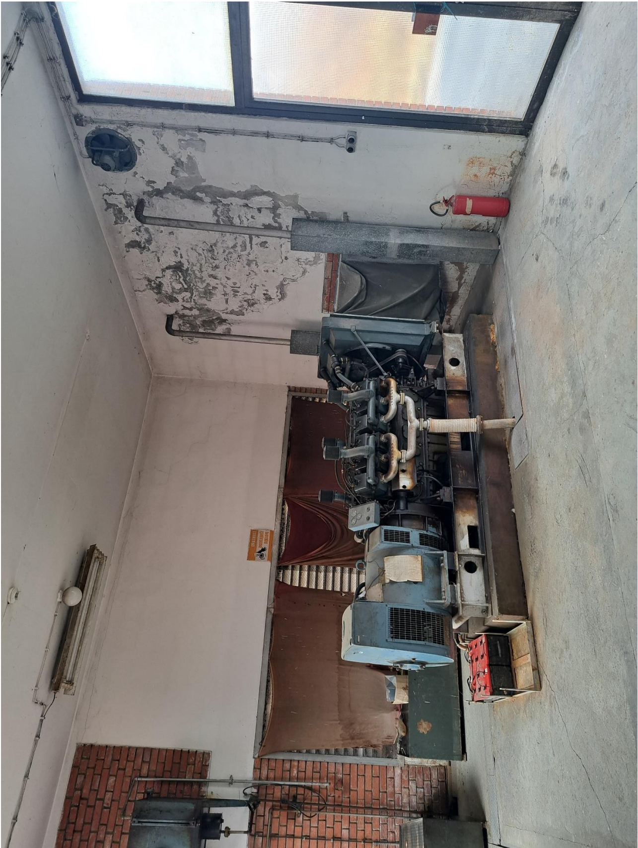
Slika 1. Mjesto ugradnje novog dizel električnog agregata