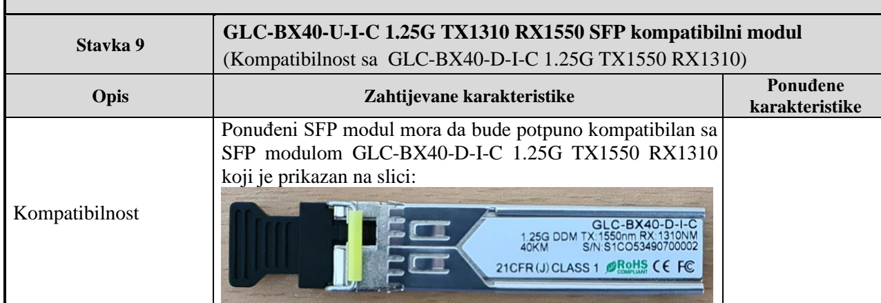
Tabela 7 - ZAHTIJEVANE TEHNIČKE KARAKTERISTIKE