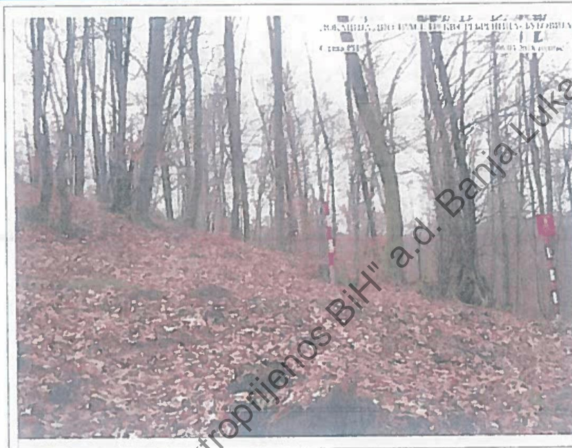
Slikano s tačke 6605603 4892147 pod uglom od 223 stepena

Ovaj projekat je autorizovan od strane BHMAC i kreiran prema akcionom planu protivminske akcije u Bosni i Hercegovini