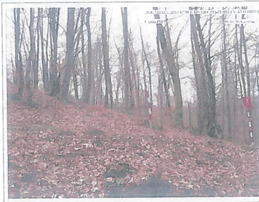
Slikano s tačke 6605603 4892147 pod uglom od 223 stepena